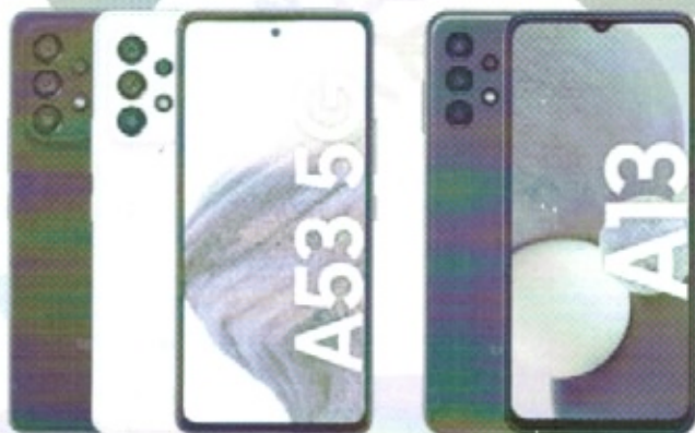
SAMSUNG Galaxy A53 5G